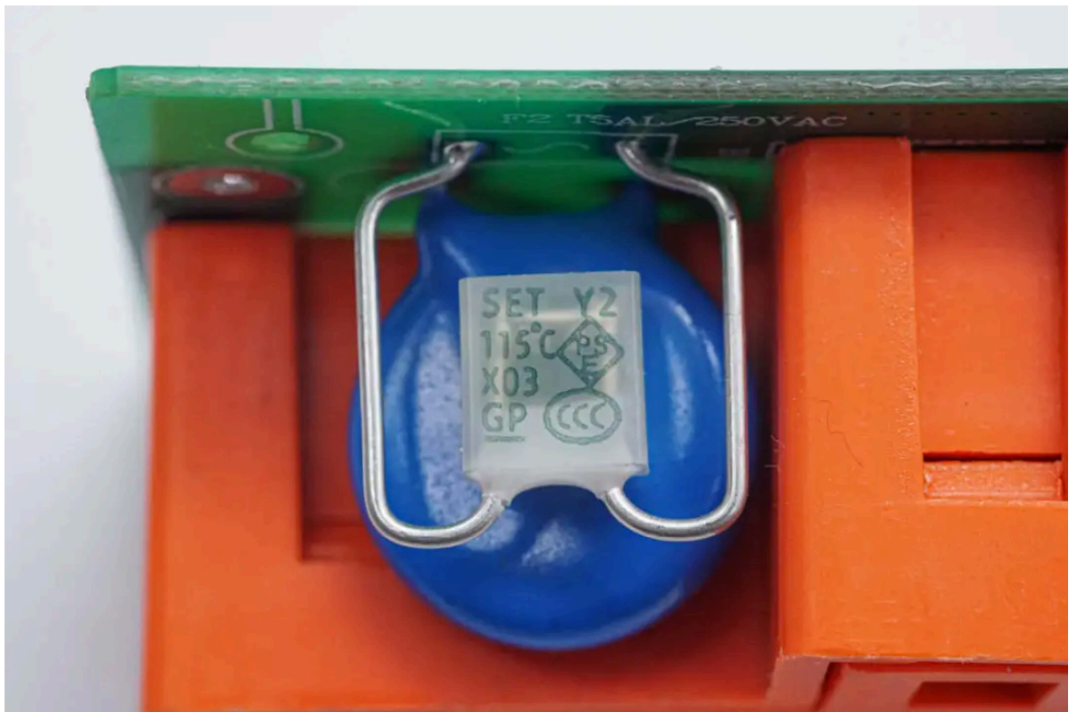
温度保险丝来自赛尔特，紧贴压敏电阻，用于压敏电阻过热保护。