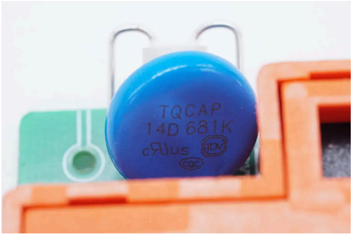
压敏电阻来自台强，规格为14D681K，用于浪涌过电压保护。