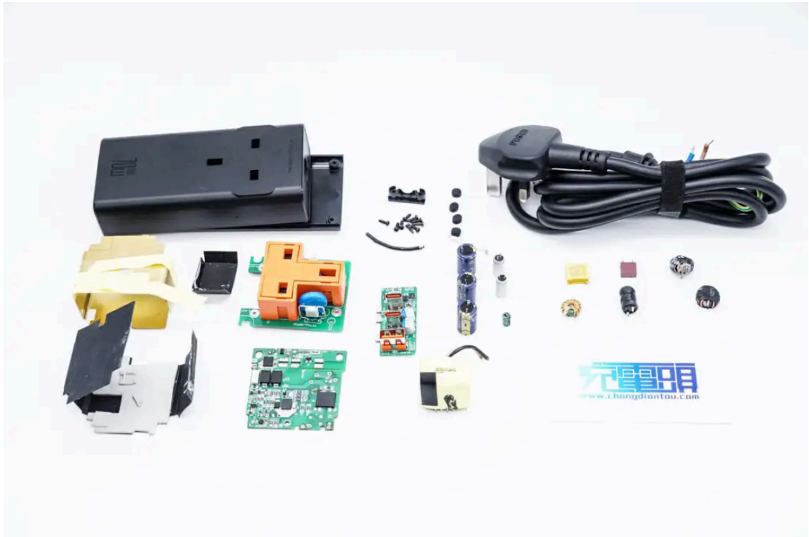
全部拆解一览，来张全家福。